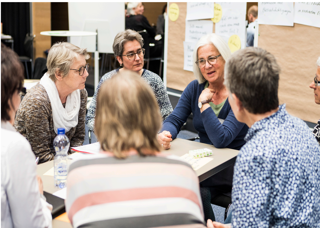
Photo: Atelier-discussion 2019, Zurich

«Les récits de vie contribuent-ils à la paix?»